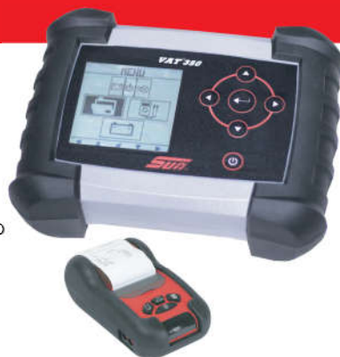
HHGA-PRINTER * impressora opcional