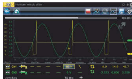
Multímetro e osciloscópio de 2 canais