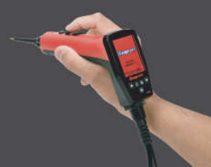
Portátil e Versátil, com cabos de 7 metros

5 cores de telas diferentes para facilitar o trabalho